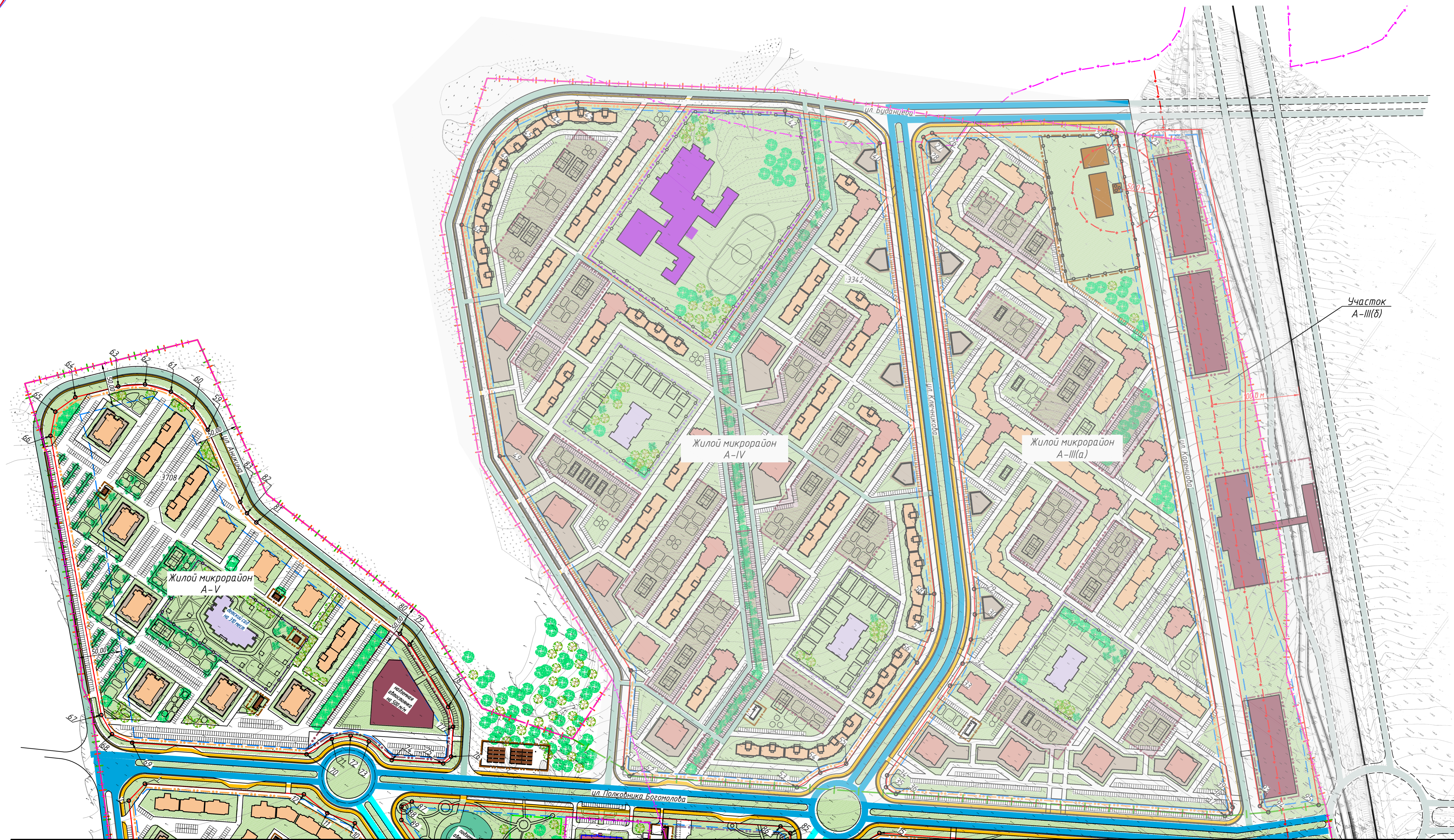
Экспликация объектов капитального строительства, прошедших государственный кадастровый учет